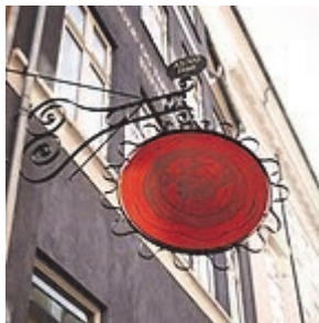
KBH. laug 550 år