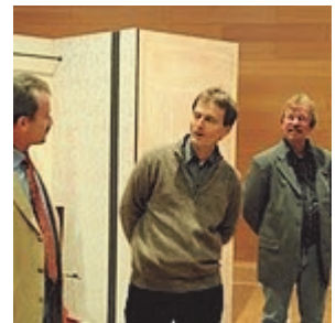
Landslauget tur til Tyskland