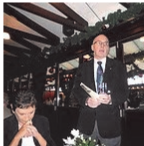
Efterårsfest i KBH. laug