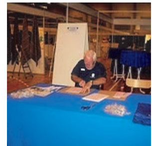
Landslauget messe i 2009